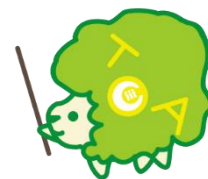
栃木県コミュニティ協会 マスコットキャラクター「コミたん」

E-mail: tochigi-community@rhythm.ocn.ne.jp